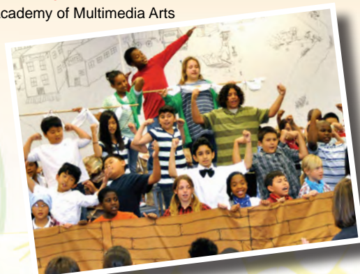
NIXON ELEMENTARY Academy of Multimedia Arts

Para mayor información, visite www.abcmagnetschools.com o llame a la oficina del Distrito ABC Magnet al (562) 926-5566, Ext. 21075.