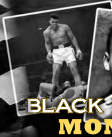
BLACK HISTORY MONTH