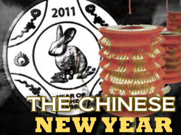
THE CHINESE NEW YEAR