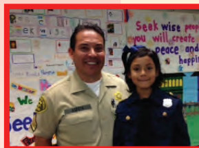
October's Neighborhood Watch Meeting, Ferguson Elementary / Reuniones de vigilancia del vecindario de octubre Ferguson Primaria

For more information please contact (562) 496-1026.